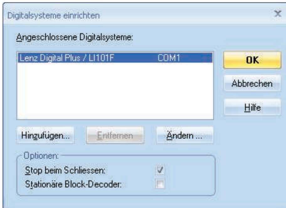
Abbildung 3: Digitalsysteme einrichten

Wenn das angezeigte Digitalsystem und/oder die serielle Schnittstelle nicht mit dem angeschlossenen Digitalsystem übereinstimmt, betätigen Sie Ändern zur Auswahl der korrekten Einstellungen.